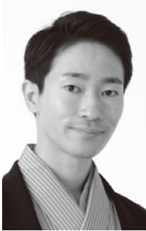
春風亭一猿（しゅんぷうていいちえん）