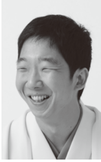
桃月庵白浪（とうげつあんしらなみ）