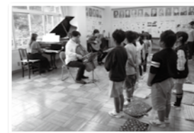
昨年の訪問の様子