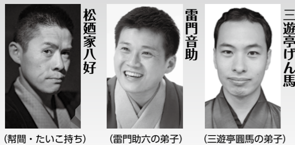
(相間・たいこ持ち) (雷門助六の弟子) (三遊亭圓馬の弟子)