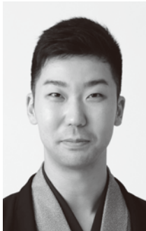
柳亭市好 (りゅうていいちこう)